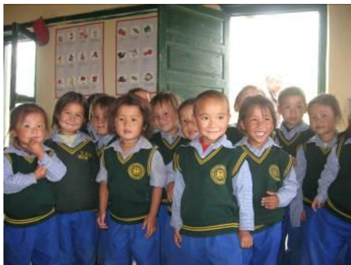
© Martine Giraudon. Classe maternelle TCV au Ladakh (Inde).

Depuis le 17 septembre 2009, l'AET a reçu également l'agrément du Comité de la Charte , qui garantit la transparence financière et la bonne gouvernance des associations faisant appel à la générosité du public.