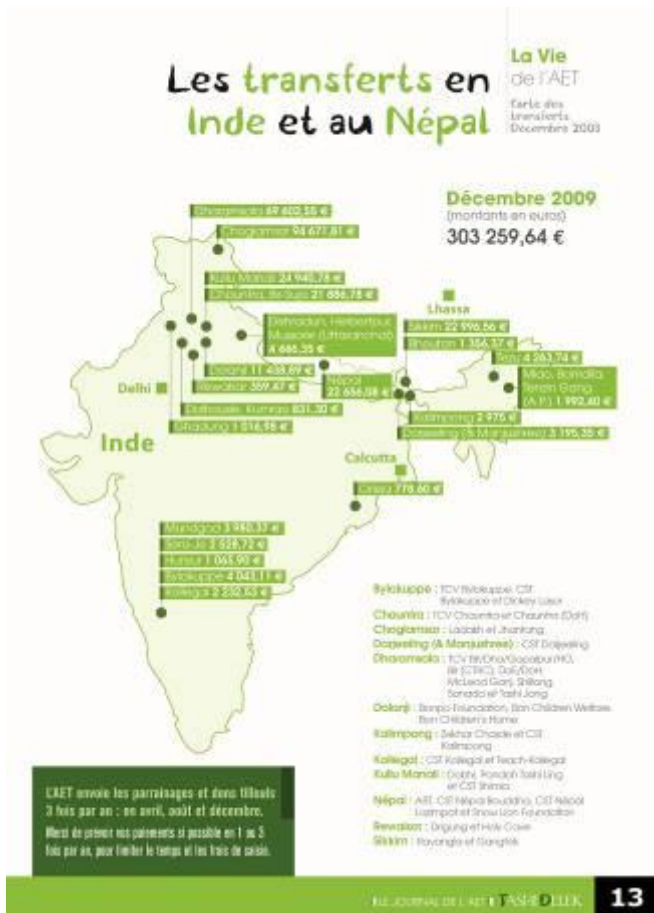
© Carte extraite du Bulletin AET, le « Tashi Delek »

Le premier principe : 85% des dons parrainages ou projets envoyés