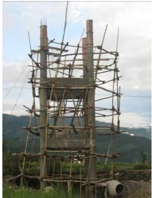
Réservoir de la Maison de retraite de Chauntra.

Des rencontres ont eu lieu en mars 2006 avec les responsables tibétains , à la faveur de la visite de 3 administrateurs en Inde, une Délégation avec le CA a renforcé les liens à l'occasion d'une tournée en Inde du Sud en février 2009 . A l'été 2013, 1 administrateur s'est rendu au Népal , 4 administrateurs vont régulièrement en Inde.