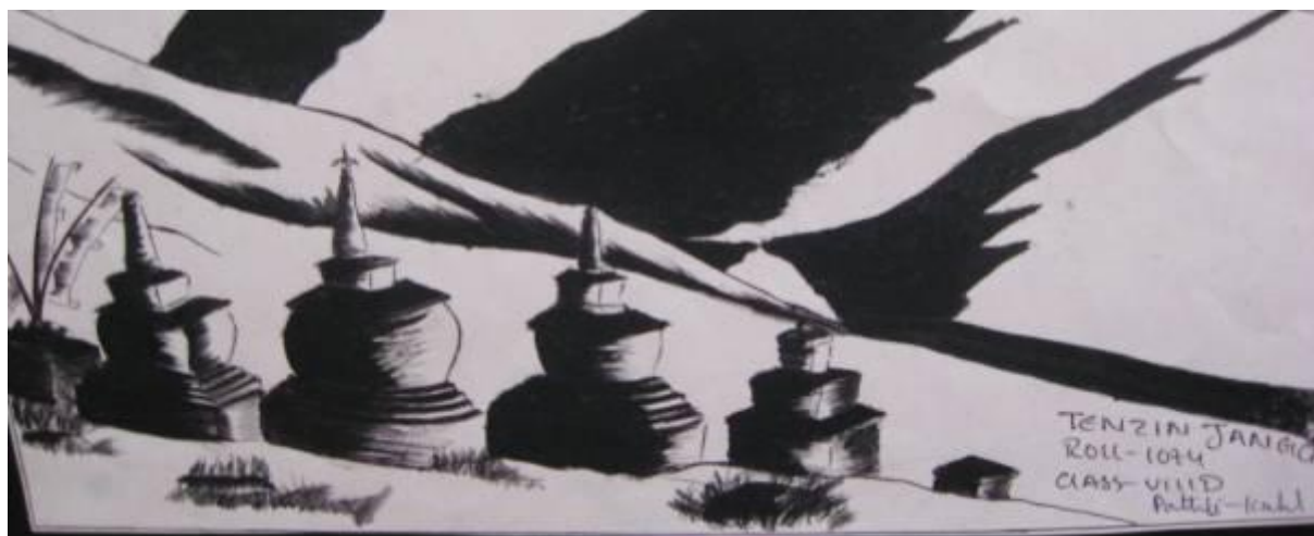
© Dessin d'enfant tibétain, école de Patlikuhl (Inde)

- L'organisation est pour des raisons politiques un peu différente, c'est la SLF (Snow Lion Foundation) , qui gère les parrainages AET. Créée en 1972 par l'Agence suisse pour le développement et la coopération, la SLF a été officiellement enregistrée par le gouvernement népalais comme organisation chargée de l'éducation, de la santé et de la solidarité des réfugiés tibétains vivant dans les camps de ce pays. AET parraine aussi de nombreux élèves, étudiants et personnes âgées au Népal.