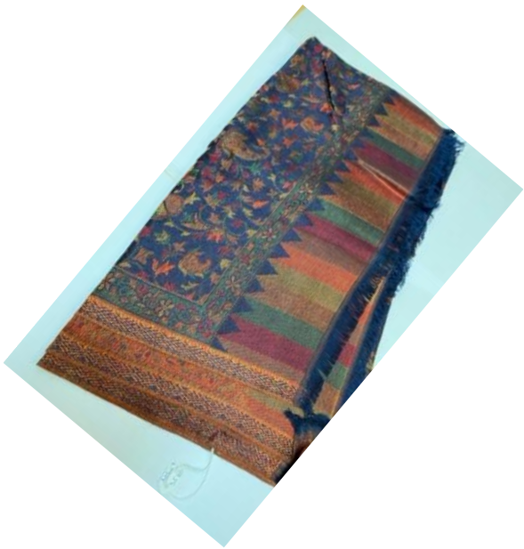
10556 Etole super Kari modal (190x73) 30,00 €